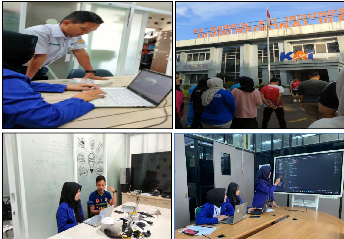
Gambar 3. Dokumentasi Kegiatan Pengabdian kepada Masyarakat

Berikut merupakan dokumentasi pada saat kegiatan berlangsung dapat dilihat pada gambar 3.