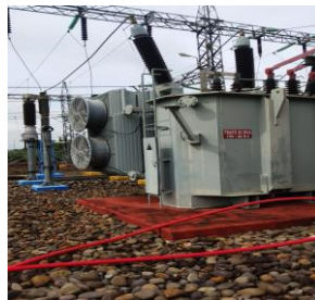
Gambar 3.2 Transformator Daya 60 MVA

Serial Number : 3011070009 Year Of Manufacture : 2008 Standard : IEC 60076 Rated Power : 42/60 MVA Cooling : ONAN/ONAF – 70/100% Frequency : 50 Hz Phases : 3 Connection Symbol : Yyn0(d1) Tap Changer : MR MS III 300Y-72.5kV + ED100S Max. Altitude : 1000 m Type Of Oil : NYNAS NITRO LIBRA Tingkat Isolasi Dasar : 650 kV