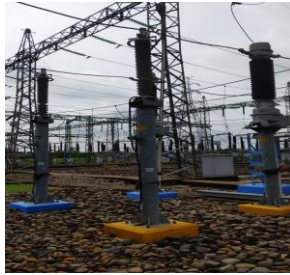
Gambar 3.1 Lightning Arrester

Merk : ABB Type : PEXLIM Q 150 - H170 Tegangan Nominal : 150 kV Arus Nominal : 10 kA Frekuensi : 50 Hz Buatan : SWEDEN Tahun Buat : 2008