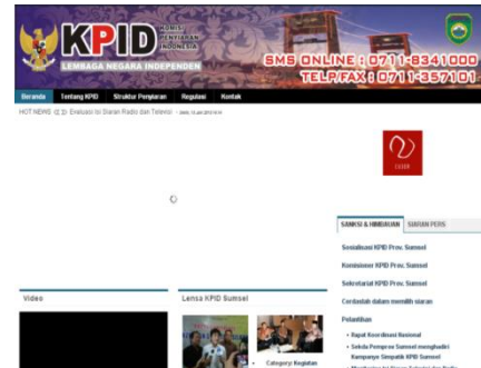
Gambar 4.4. Tampilan Wabsite KPID Sumsel

menyampaikan informasi tentang aktifitas kelembagaan KPID Sumatera Selatan serta akan lebih memudahkan masyarakat dalam mengakses dan menyampaikan masukan / kritikan ke KPID Sumatera Selatan mengenai penyiaran dapat di akses di www.kpid.sumselprov.go.id