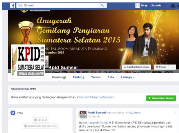
Gambar 4.2. Tampilan Facebook KPID Sumsel

Daerah Sumatera Selatan sebagai berikut : Tampilan akun Facebook Komisi Penyiaran Indonesia Daerah Sumatera Selatan yang menjadi saluran komunikasi dan publikasi untuk berbagi informasi tentang aktivitas kelembagaan KPID Sumatera Selatan dapat diakses di https://www.facebook.com/kpid.sumsel .