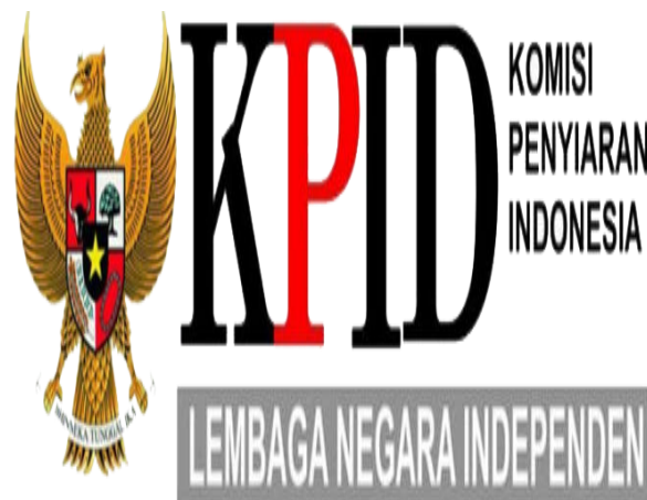
Gambar 4.1. Logo KPID

bahan studi pustaka untuk menambah informasi penelitian serta membuka arsip atau dokumen, hasil dari observasi yang dilakukan oleh peneliti selama penelitian berlangsung seperti mengumpulkan data serta foto-foto yang mendeskripsikan tentang tentang Peranan Komisi Penyiaran Indonesia Daerah Sumatera Selatan Dalam Pengaturan dan Tindakan Program Siaran Kesehatan Pengobatan Tradisional Pada Televisi PALTV.