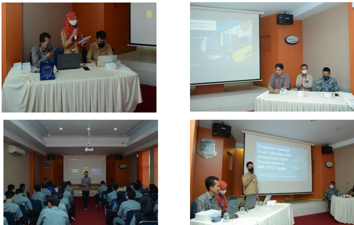
Gambar 3. Kegiatan PkM di SMK IPTEK Tangerang Selatan

Kegiatan PkM yang telah dilakukan dengan memberikan materi tentang Pengenalan Teknologi Cloud Computing dalam upaya percepatan digital transformation untuk SMK IPTEK di Tangerang Selatan. Kegiatan ini juga didampingi Tim PkM yang berasal dari Program Studi Teknik Informatika yang memberikan pemahaman dalam pentingnya teknologi Cloud Computing untuk mempercepat digital transformation di masa perkembangan digital sekarang ini. Hal ini menjadi bagian penting untuk mempersiapkan generasi lulusan SMK yang siap di serap dalam dunia Industri.