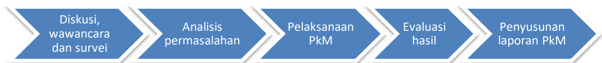
Gambar 2. Tahapan Pelaksanaan PkM

Tahapan dalam pelaksanaan kegiatan PkM pada SMK IPTEK Tangerang Selatan adalah sebagai berikut: